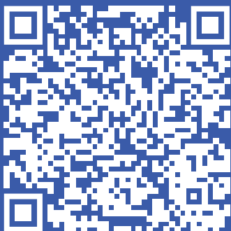
Короткометражные фильмы, которые можно посмотреть на профилактическом занятии 1 часть

В качестве дополнительных материалов можно ознакомиться с подборкой фильмов, которые можно посмотреть со школьниками в рамках других профилактических мероприятий в формате кинопросмотра: